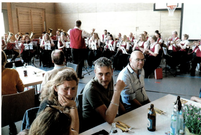
Der Musikverein Gussenstadt erfreute die Gäste musikalisch in der neu erbauten Turn- und Festhalle in Gussenstadt mit seiner Blasmusik.