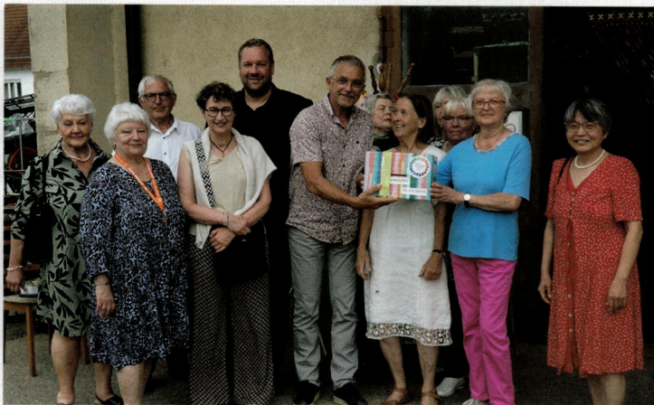
Der Second-Hand-Shop des „Freundeskreis Integration Gerstetten“ im Alten Postgebäude öffnete am Samstag seine Pforten für die französischen Gäste. Der Erlös soll der Jugendarbeit der Partnerschaften zugutekommen.

Als Symbol der Freundschaft tauschten die Komitees noch Briefe von Grundschulern aus Cébazat, Heldenfingen, Dettingen aus. Die Gerstetter Schule hat schon weitere im Entstehen. Das Resümee vieler, ließ die Organisatoren zufrieden die Gäste verabschieden: „merci bien“, „très bien, très bien“, „impressionnant“, „war edd ganz schlecht“ war zu hören. Beim „à bientôt, tschüss und bis bald“ wurden etliche Bierkisten direkt vom Getränkemarkt eingeladen und zuvor zwei Kisten Wein aus der Auvergne als Gastgeschenk übergeben. (PM)