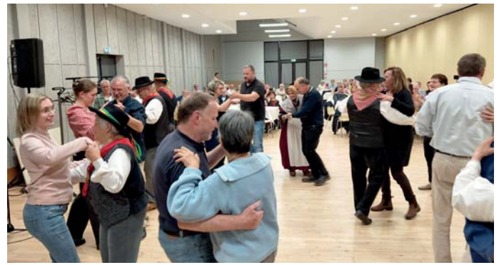
Der Abschlussabend mit gutem Essen und Folkloretanz.

Zum Abendessen traf sich die Gesellschaft wieder im Sémaphore zu einem geselligen Abschlussabend. Nach einem Aperitif, auch mit Bier aus Gerstetten, wurde zum Abendbuffet eingeladen.