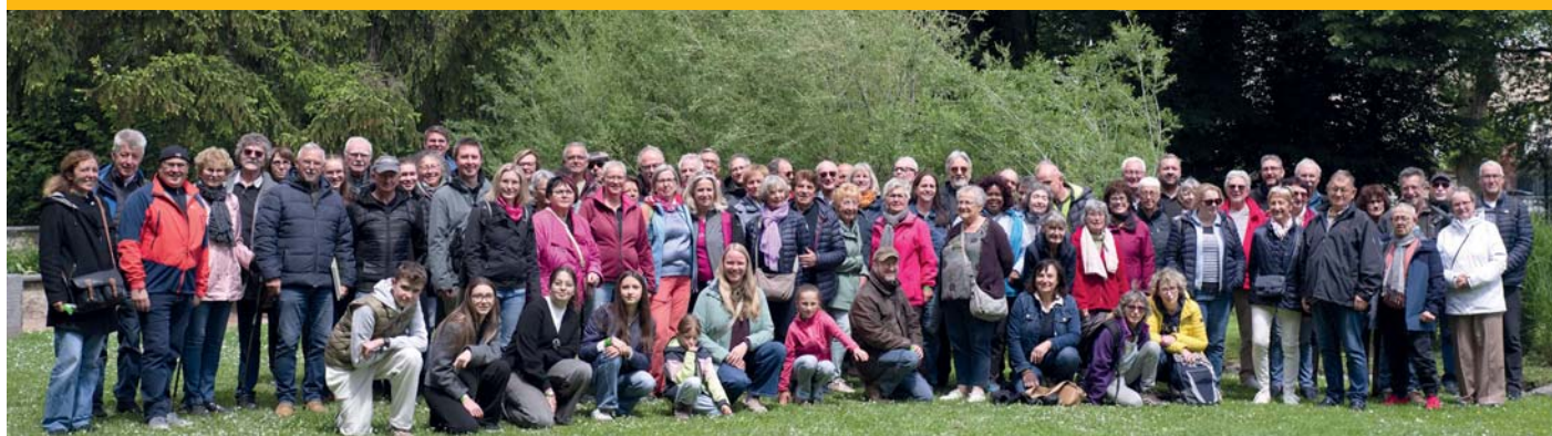
Fast 50 Teilnehmerinnen und Teilnehmer reisten über Himmelfahrt in die französische Partnerstadt Cébazat

Ein abwechslungsreiches Programm erlebten am vergangenen Wochenende die Teilnehmer der „Jedermannfahrt“ aus Gerstetten in der französischen Partnerstadt Cébazat. Jedes Jahr über Himmelfahrt werden abwechselnd die Partnerstädte besucht. Es werden lang bestehende Freundschaften gepflegt und auch neue Kontakte geknüpft. Nach einer über 800 km langen Fahrt wurden die Gerstetter wie immer aufs Herzlichste empfangen. Nach guter alter Tradition wohnten die Teilnehmer bei ihren Gastfamilien, wo sie immer bestens versorgt werden.